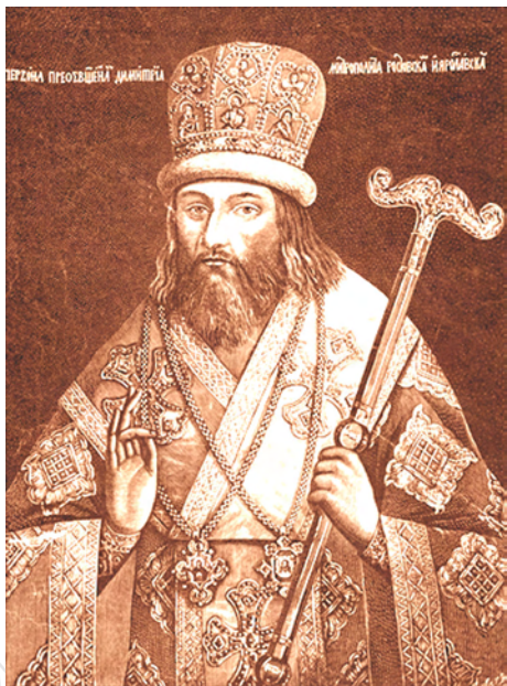
Святитель Димитрий Ростовский (Родился в декабре 1651 года в местечке Макарове на Киевщине – скончался 28 октября 1709 года в Ростове Великом)